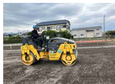
まき出し・転圧・敷き均し3