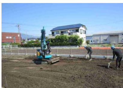
まき出し・転圧・敷き均し2