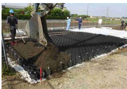
5. まき出し・転圧・敷き均し1